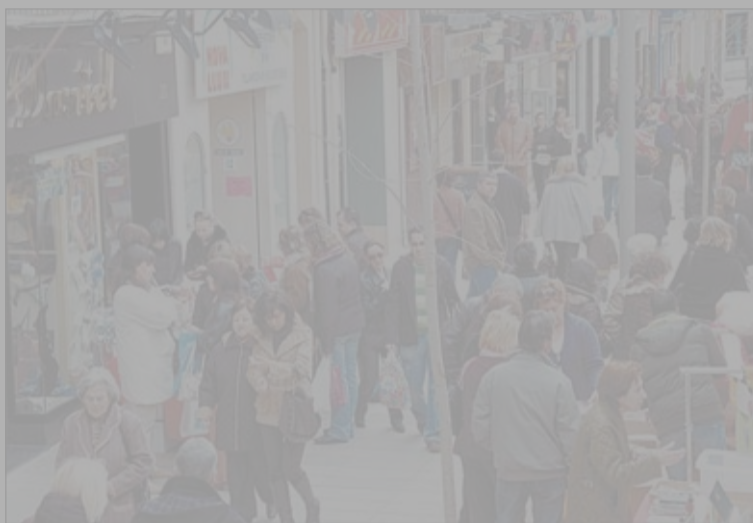
Los comercios catalanes podrán abrir dos festivos más durante el año

Con la aprobación de esta ley, el Parlament restringe la liberalización que impone la normativa española,