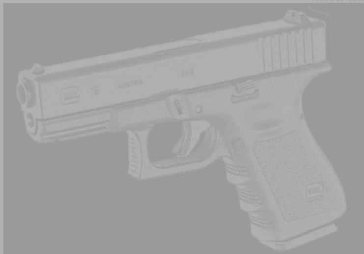
La pistola austríaca Glock, model 19, l'arma del crim de Cappellet el 2006